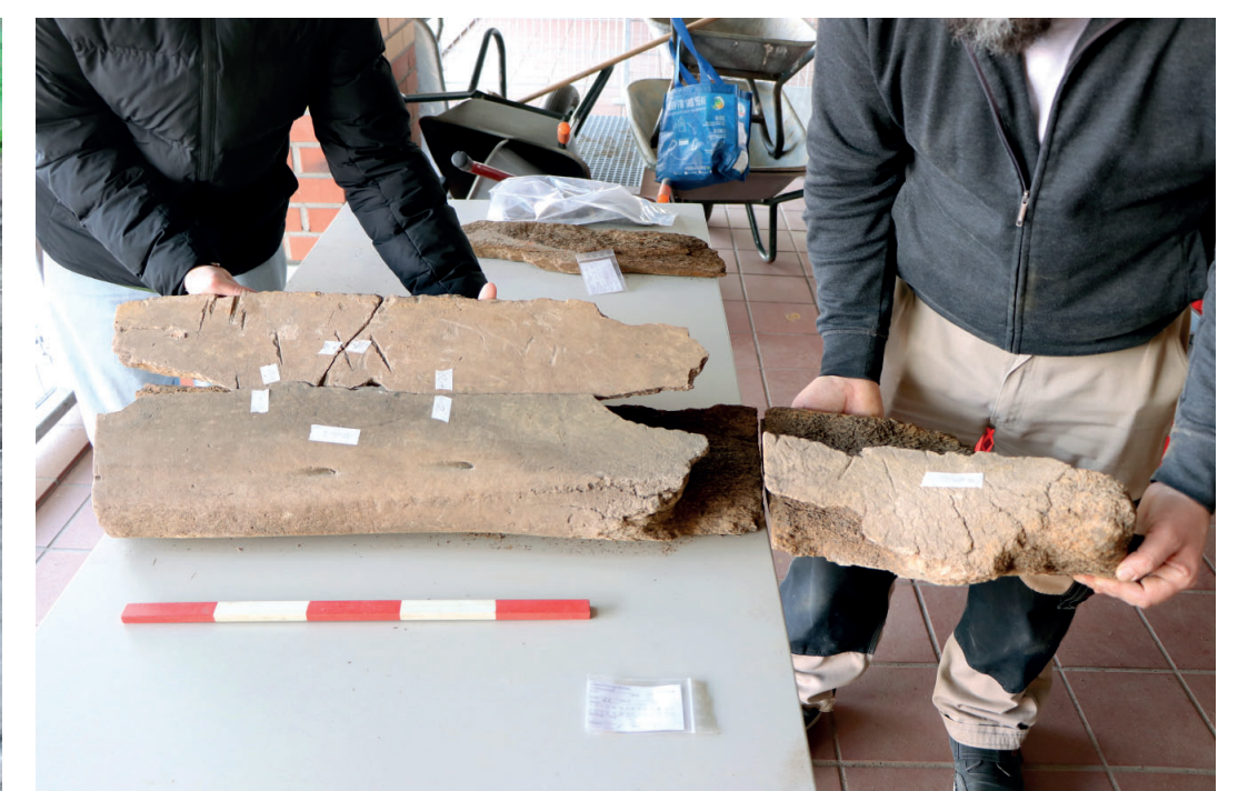
Abb. 7: XXL-3D-Puzzle, 29. 3. 2023