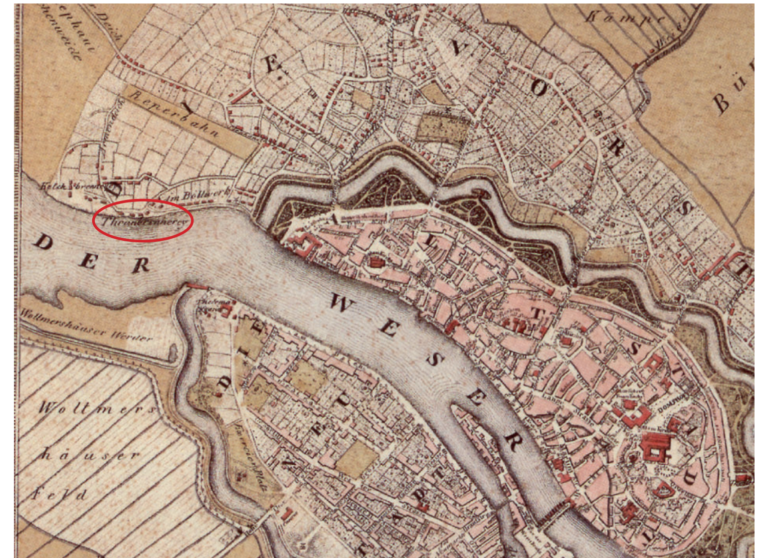
Abb. 1: Stadtplan von Heinrich Bornemann von 1829 mit Thranbrennerei am Stephanitorsbollwerk (aus Schwarzwälder 1985, 36, Kat.-Nr. 140)

fangen wurde (Abb. 2). Ein anderer Grund war das Repräsentationsbedürfnis der Kommandeure (Kapitäne) und Reeder, die sich gerne ein Walkiefertor als Statussymbol vor den Hauseingang stellten. Von solchen Walkiefertoren sind in Bremen noch mehrere erhalten, z. B. in Lesum, Leuchtenburg, Oberneuland (Abb. 3) und im Focke-Museum. Weniger bekannt ist, dass Walkiefer auch für eine Vielzahl anderer Funktionen Verwendung fanden, z. B. als Scheuerpfähle für Rinder, als Bauelemente in Häusern und – nicht selten – als Wegbegrenzungen. Historisch dokumentiert sind solche damals als „Radabweiser“ oder „Prellsteine“ bezeichneten Begrenzungspfähle bzw. Leitpfosten in Bremen u. a. in den Wallanlagen (Abb. 4), an der Domsheide (Abb. 5), am Stephanitorsbollwerk, an der Doventorsmühle und in Knoop's Park.