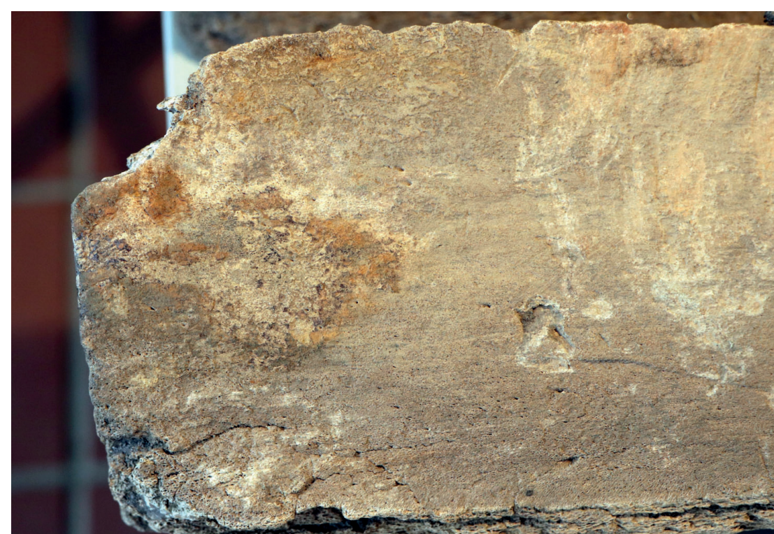
Abb. 8: Rostspuren einer eisernen Abdeckung an der Oberkante eines Pfostens. 29. 3. 2023