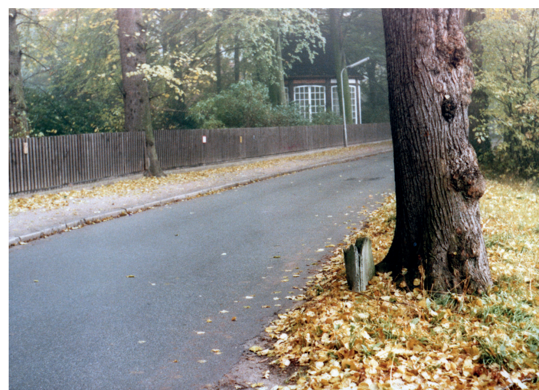
Abb. 9: Walkiefertor an der Oberneulander Landstraße 26-28, im Hintergrund der „Teepavillon“ aus dem 18. Jahrhundert, 27. 10. 1981