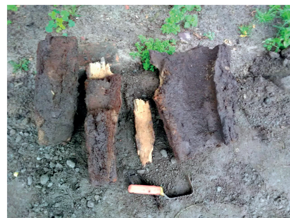
Abb. 6: Walknochenfragmente Oberneulander Landstraße 20b am Fundort, 30. 6. 2021

an der Oberneulander Landstraße auf 120 m Länge „Stücke von Walkiefiern“ als „Prellsteine“ aufgestellt. Den Begleitfunden aus der Baugrube nach zu urteilen, wurden die Pfosten in den 1920er Jahren entsorgt. Ein letzter Pfosten dieser Reihe überlebte jedoch bis in 1980er Jahre (Abb. 9), bevor er einem Auto zum Opfer fiel. Ein weiterer, ebenfalls vergrabener Pfosten wurde 1980 bei Bauarbeiten an der Oberneulander Landstraße 25 entdeckt (Abb. 10).