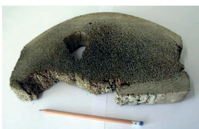
Abb. 10: Segment des Walkiefertorfundes von der Oberneulander Landstraße 25.